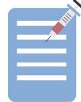
Registro de vacunación

Para los que califiquen según sus ingresos: