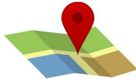
Comprobante de domicilio