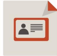
Identificación del I padre I